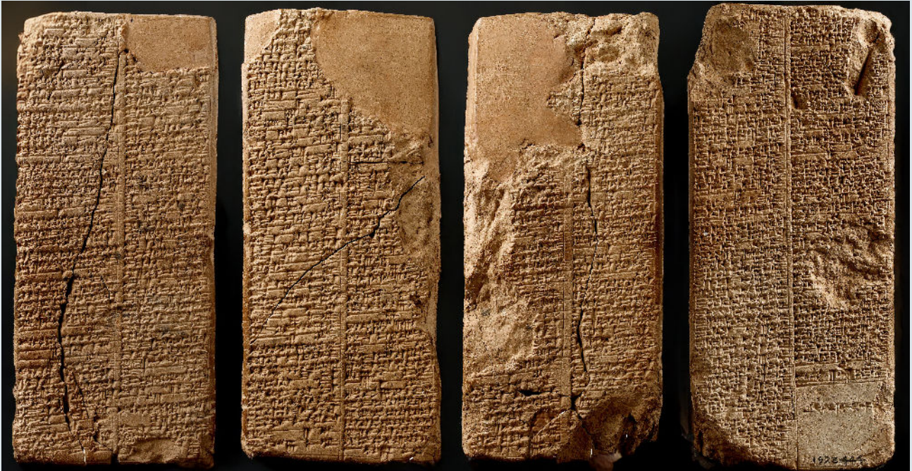
Kleitabellen uit een van de oudste bibliotheken ter wereld, de Koninklijke Bibliotheek van Ashurbanipal (669 - 631 v.Chr.), met daarop het Babylonische scheppingsverhaal Enoema Elisj . Ashmolean Museum, Verenigd Koninkrijk.

De oude wereld kent vele honderden scheppingsverhalen. Bijna allemaal beginnen ze met een vormeloze chaos.